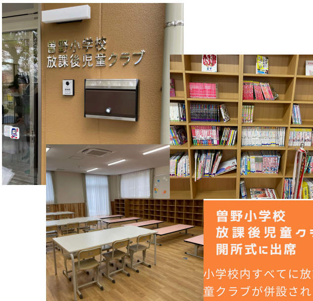
曾野小学校 放課後児童クラブの 開所式に出席

小学校内すべてに放課後児童クラブが併設されました。 子どもたちの利用がない時間は、一般の方も利用が可能です!